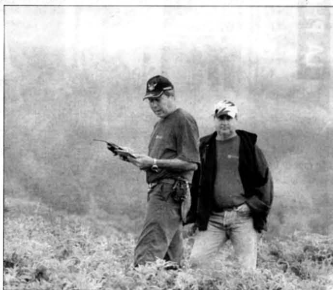
Il fallait du courage pour grimper jusqu'au sommet du Dogny. Il en fallait aussi pour assurer les postes de contrôle. Bravo aux bénévoles!