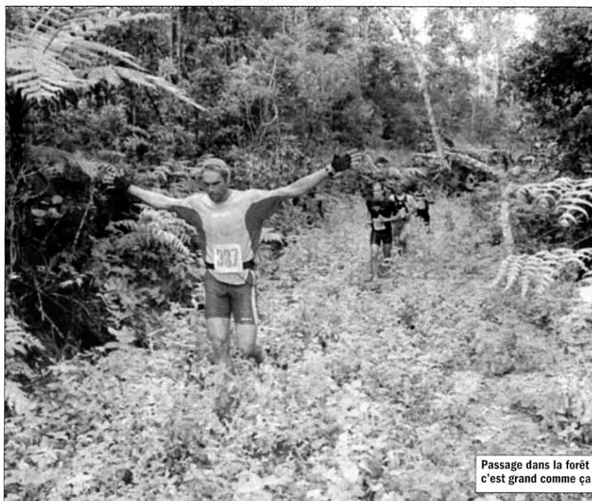
Passage dans la forêt : le Dogny, c'est grand comme ça !